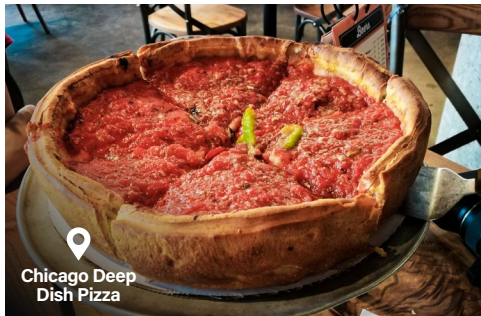
Chicago Deep Dish Pizza