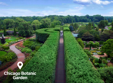
Chicago Botanic Garden