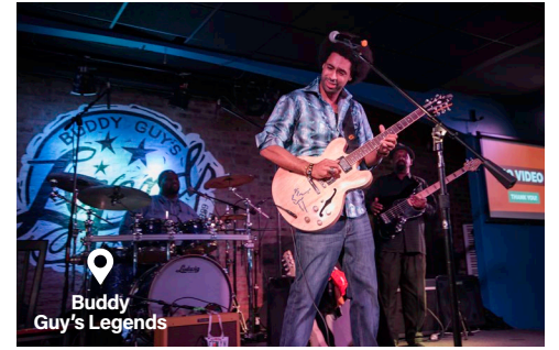
Buddy Guy's Legends