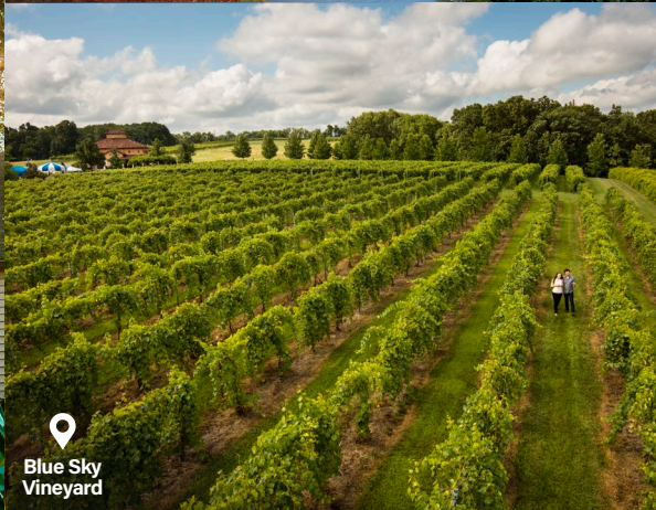
Blue Sky Vineyard