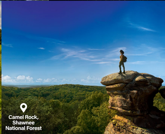
Camel Rock, Shawnee National Forest