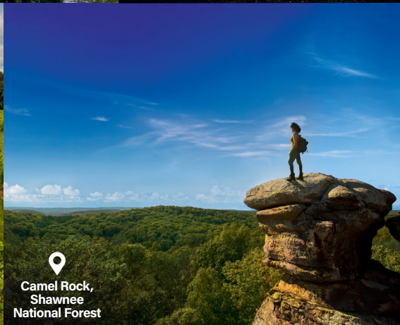
Camel Rock, Shawnee National Forest