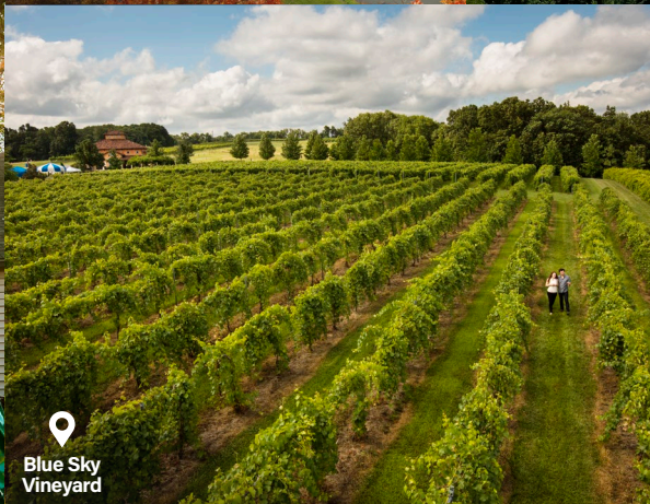
Blue Sky Vineyard