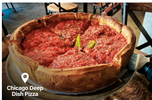
Chicago Deep Dish Pizza