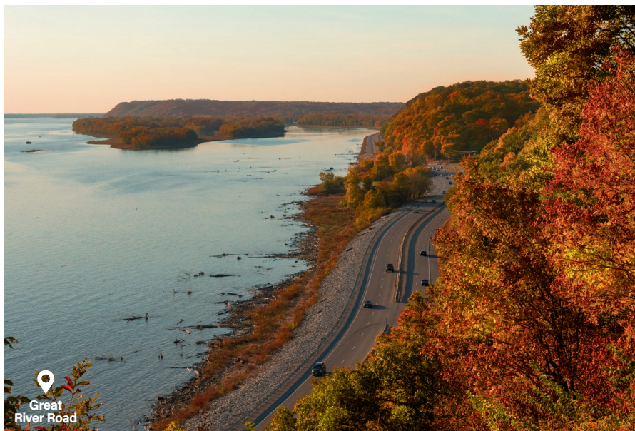
Great River Road

Chicago Joliet Pontiac Springfield Edwardsville