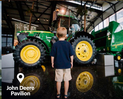
John Deere Pavilion