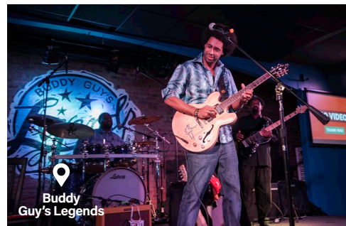
Buddy Guy's Legends