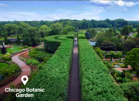
Chicago Botanic Garden