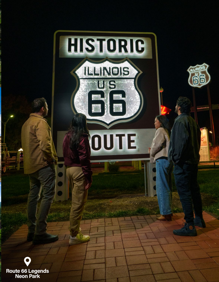
Route 66 Legends Neon Park