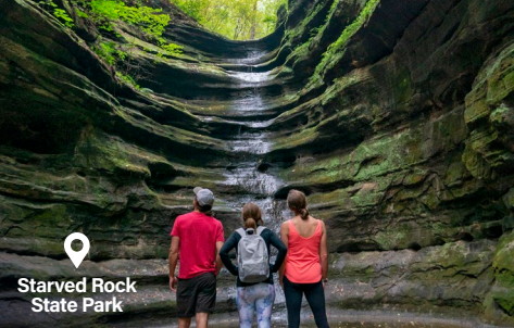
Starved Rock State Park