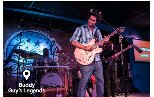
Buddy Guy's Legends