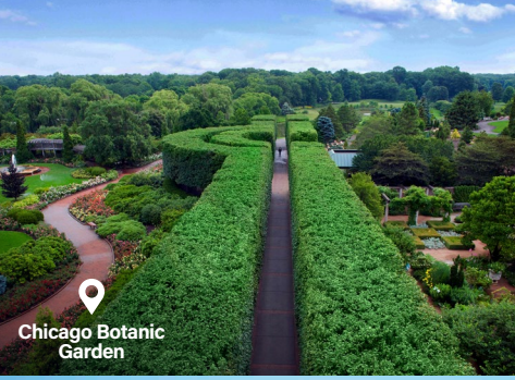
Chicago Botanic Garden