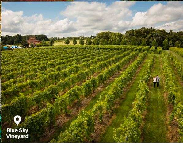
Blue Sky Vineyard