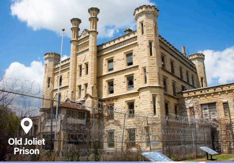
Old Joliet Prison