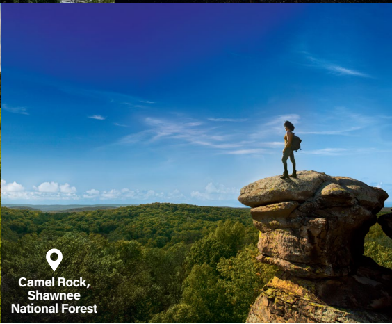
Camel Rock, Shawnee National Forest