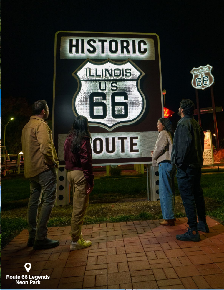
Route 66 Legends Neon Park