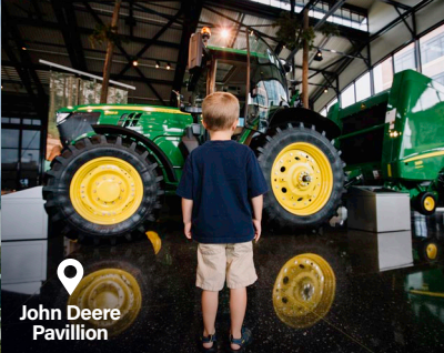
John Deere Pavillion