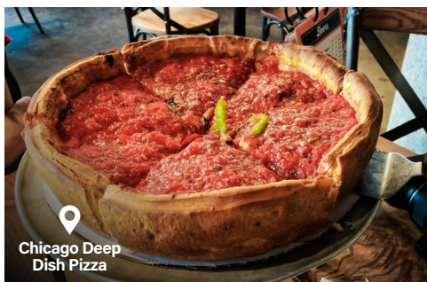
Chicago Deep Dish Pizza