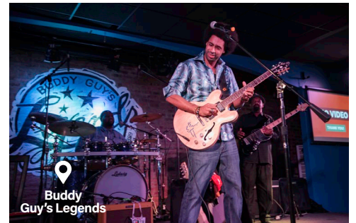
Buddy Guy's Legends