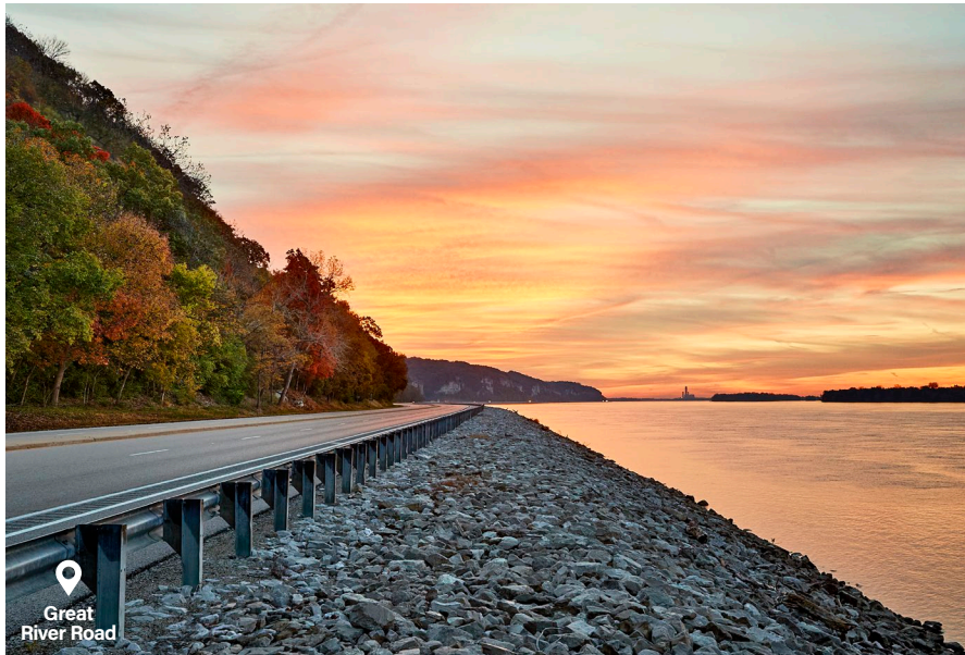
Great River Road

Chicago Joliet Pontiac Springfield Edwardsville